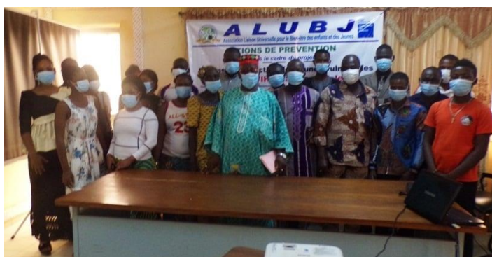
Journée de communication avec les acteurs et actrices à Pouytenga avec le soutien de la Fondation de France.

Durant l'année, cinq (5) rencontres visant à faire le plaidoyer ou informer les membres de l'association et les acteurs clé ont été réalisées. Pour le plaidoyer, deux journées de communication ont été réalisées à l'endroit des gérants des sites pour les interpeller sur le respect des droits des filles et des femmes employées comme serveuses de bars ou TS. Ces actions sont inscrites dans le cadre