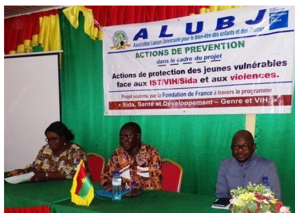
Action soutenue par la Fondation de France dans le cadre de la lutte contre le Sida et les VBG

Egalement, grâce à la bonne collaboration avec la Fondation de France, l'ALUBJ parvient à étendre ses actions en allant au-delà de la région du Centre pour mener ses actions en faveur des couches vulnérables. En 2021, la Fondation de France a réaffirmé cette collaboration par la reconduction du projet soumis par l'ALUBJ pour mener ses actions de lutte contre le Sida dans trois régions du Pays notamment la région du Centre, celle du Centre-est et celle du Plateau Central.