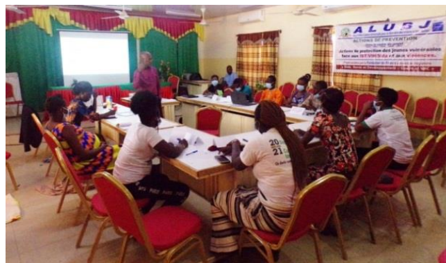
Formation des animateurs et animatrices sur la prévention des IST/VIH/Sida et les VBG à Ziniaré dans le cadre du projet soutenu par la Fondation de France.

Pour cette année 2021, quatre (4) ateliers de renforcement de capacité des membres ont été réalisés. Parmi les quatre, deux ateliers ont été réalisés dans le cadre de la mise en œuvre du projet soutenu par la Fondation de France. Le premier fut réalisé dans la ville de Ziniaré au profit des actrices de la Coordination ALUBJ/Oubritenga et le second à Pouytenga au profit des intervenant.e.s de la Coordination de ALUBJ/Kouritenga. Ces