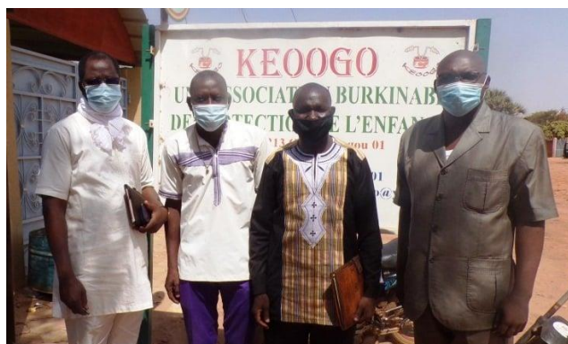
Sortie de rencontre d'échange avec les responsables de l'association KEOOGO pour le suivi des filles victimes de violence.

Avec l'Association KEOOGO : La collaboration avec cette structure a pour objectif de permettre à nos bénéficiaires victimes de violences de bénéficier d'une prise en charge. Cette année, deux (2) personnes, victimes de VBG ont été référées vers cette structure pour bénéficier d'une prise en charge complète. Dans le cadre de cette collaboration, quelques difficultés ont été rencontrées à travers les démarches pour obtenir les réparations après préjudices causés aux filles. En effet, l'ignorance des textes juridiques par les