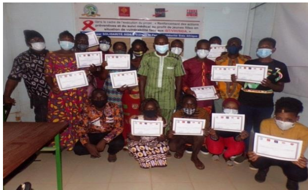
Formation des acteur.trices en counseling du VIH et l'index testing dans le cadre du projet soutenu par Solidarité Sida via le fonds Solidarité Sida Afrique.

La troisième formation a été organisée dans le cadre de la mise en œuvre du projet soutenu par Solidarité Sida. Il s'est agi de renforcer les capacités des animatrices et des leaders des bénéficiaires sur le counseling du VIH et l'index testing. La quatrième formation a été réalisée dans le cadre de la mise en œuvre du plan d'action de lutte contre le Sida, soutenu par le SP/CNLS-IST. Cette formation s'est tenue à Ouagadougou et elle a porté sur la Réduction des Risques liés à l'usage des drogues.