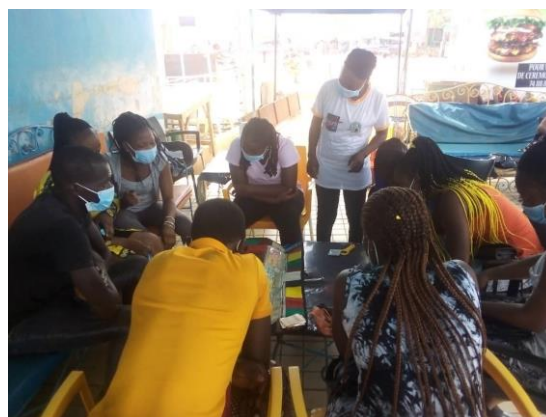
Séance de jeu sans tabou avec les bénéficiaires dans le cadre du projet soutenu par Solidarité Sida.

Les activités de prévention des IST/VIH/Sida et des VBG à travers l'IEC/CCC ont été réalisées à travers l'ensemble des projets soutenus par les partenaires. Ces activités ont concerné des séances de causeries éducatives et des séances de jeux sans tabou marquées par des distributions de condoms et de gels pendant et après les animations. Les thèmes abordés ont porté sur les modes de prévention, les modes de protection, le port correct du port de condoms masculin et féminin, les VBG, l'importance des visites médicales, les IST et le bien-fondé de la réduction des risques liés à l'usage des drogues. Les supports utilisés ont été des boîtes à images, des dépliants, la maquette du jeu sans tabou, le phallus, le pénis en bois.