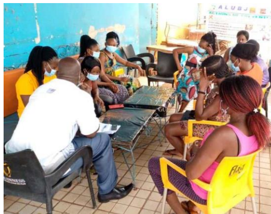
Focus groupe avec des bénéficiaires de ALUBJ pour avoir leurs appréciations sur le déroulement des actions en leur faveur.

Au niveau de l'association, les activités réalisées dans le cadre des projets ont été suivies par la Chargée de la Planification et du suivi des activités, le Directeur Exécutif et parfois par le Président de l'association. A travers les planifications des sorties de supervision et la réalisation des missions d'appui aux coordinations dans les provinces, les activités planifiées étaient suivies. De manière externe, le formateur a effectué des sorties de supervision des activités et l'évaluateur externe quant à lui a effectué des rencontres avec les acteurs clés et des bénéficiaires à travers l'organisation de Focus group. Quatre (4) focus group ont été réalisés et ont permis à l'évaluateur externe de s'entretenir avec des bénéficiaires et recueillir les préoccupations et les besoins pour une amélioration des services et prestations.