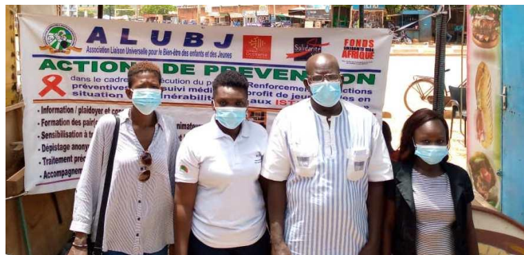
Image de l'Evaluateur Externe avec les actrices de ALUBJ à la sortie d'un Focus group.

Comme évolution enregistrée au cours de l'année 2021, nous pouvons mentionner que le taux d'exécution des activités prévues a été satisfaisant. Aussi, il a été constaté une bonne amélioration dans le suivi des activités planifiées car les actions ont été suivies à trois (3) niveaux à savoir par la Chargée de planification et du suivi, par le formateur et enfin par l'Evaluateur Externe à travers le focus group. En plus de cela, au niveau des coordinations provinciales, une nouvelle coordination a bénéficié de l'appui du SP/CNLS-IST pour la mise en œuvre de son plan d'action. Ce qui est une avancée dans le cadre de la mobilisation des ressources pour nos coordinations.