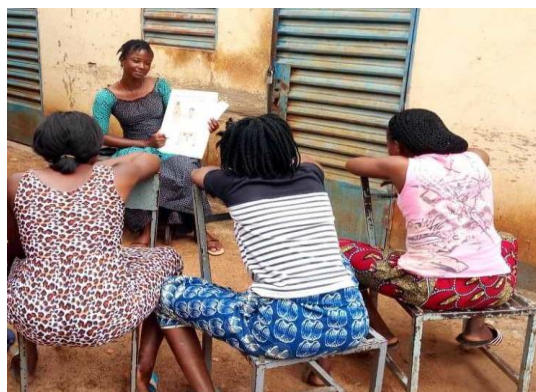
Photo lauréate du prix du concours photos de la Plateforme Elsa en 2021

Cette année, la collaboration entre ALUBJ et la Plateforme Elsa s'est renforcée davantage grâce à la participation de l'ALUBJ aux différentes activités organisées par cette structure qui contribue à la visibilité de l'ALUBJ à travers son site Web. ALUBJ a pris part au concours photo organisé chaque année par la Plateforme Elsa et a bénéficié pour une deuxième fois, du prix concours photo grâce à la sélection de l'image ci-