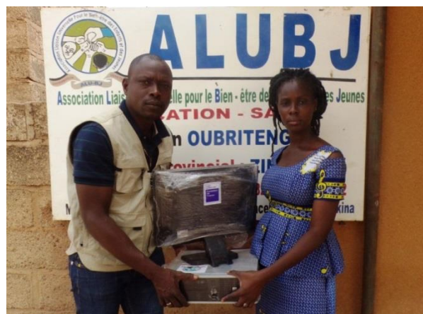
Dotation accordée en matériels de bureau aux coordinations provinciales grâce au soutien de la Fondation de France.

formations ont permis de rendre disponible au sein de l'association des personnes ressources aptes à intervenir au profit des bénéficiaires. Au niveau des coordinations provinciales, l'appui de la Fondation de France a permis à l'association de renforcer les capacités de ses coordinations en matériels et cela a contribué à renforcer l'efficacité des coordinations. Aussi, cet appui a permis d'atteindre plus de bénéficiaires à travers d'autres localités. De nos jours, grâce aux actions, l'ALUBJ est de plus en plus active et visible à travers les actions qu'elle mène dans ses coordinations provinciales.