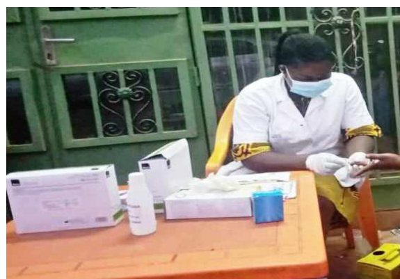
Sortie de dépistage du VIH au profit des bénéficiaires grâce au soutien de Solidarité Sida

A travers les activités de sensibilisation, des jeunes filles étaient référées vers les centres de prise en charge pour bénéficier de consultation suivies de traitements précoces en cas d'IST. En sommes 155 jeunes filles ont eu accès aux agents de santé pour se faire consulter et traiter. A travers le projet soutenu par Solidarité Sida, des sorties de dépistage du VIH étaient organisées à chaque deux mois. En somme, 10 sorties ont été réalisées et ont permis de dépister 1500 personnes regroupant des TS, des filles de bars et des clients. Le dépistage a permis d'identifier cinq (5) cas positifs.