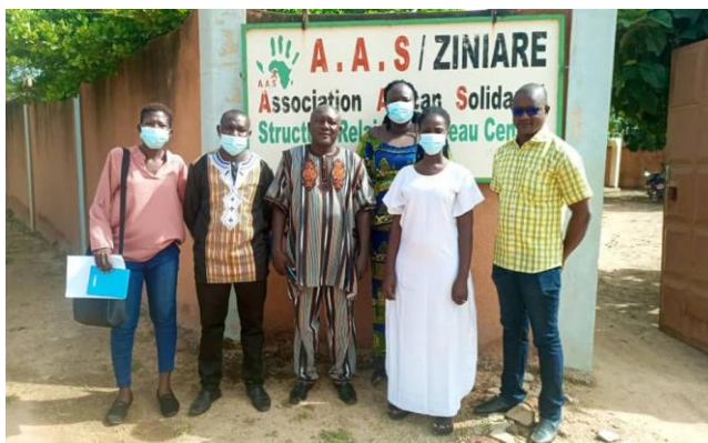
Sortie d'une rencontre d'échange sur l'accompagnement bénéficiaires avec les responsables de AAS/ Ziniaré

Avec AAS : La collaboration est établie dans le cadre de la prise en charge des PV/VIH. En effet, à travers nos campagnes du dépistage du VIH, les personnes dépistées positives sont référées vers l'AAS pour une prise en charge. Cette année, sur les 5 cas dépistés positifs, deux (2) y ont été référés et accompagnés pour une prise en charge. Cette collaboration se déroule bien car elle permet aux personnes séropositives, surtout celles dépistées pour la première fois d'être soulagées car, une fois référée vers cette association, elles ont un accès facile en ARV après réalisation de quelques examens préliminaires.