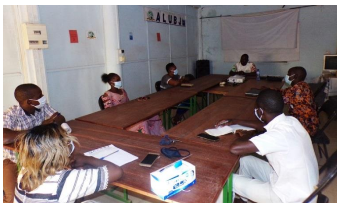
Rencontre hebdomadaire de l'équipe de la Direction Exécutive pour le bilan des actions écoulées et la planification des actions de la semaine

Les rencontres entre les membres de la Direction Exécutive sont prévues pour se tenir une fois par semaine. Ces rencontres visent à faire le point sur les actions de la semaine écoulée, planifier celles de la semaine en cours et répartir les tâches de chacun. Au total, quatorze (14) rencontres ont pu se tenir, car pour des raisons liées à l'occupation des membres par des actions sur le terrain, la réalisation de missions d'appui aux coordinations provinciales ou la participation des membres à des séances de formation organisées par l'association ou par des partenaires, les rencontres hebdomadaires ont parfois été perturbées.