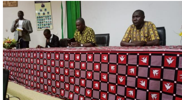
Animation d'un Panel à Ziniaré sur la consommation des stupéfiants et les conséquences sur la santé